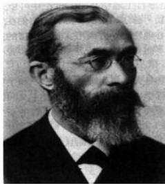
冯特(Wilhelm Wundt, 1832—1920)为科学心理学的创始者，实验心理学之父，创建了一支国际心理学专业队伍，奠定构造主义心理学派的基础；是感情“三度说”的倡议者，也是使心理学脱离哲学范畴，成为一门独立科学的倡导者。

心理学（psychology）一词来源于希腊文，是由“灵魂”（psyche）和“讲述”（logos）两个词组合而成的，意思是关于灵魂的学问。灵魂在希腊文中也有气体或呼吸的意思，古代，人们认为生命依赖于呼吸，呼吸停止，生命就完结了。随着科学的发展，心理学的对象由灵魂改为心灵。由于当时人们对心灵的研究包含在哲学中，因此心理学属于哲学的范畴。直到19世纪中叶，德国心理学家冯特（W.Wundt, 1832—1920）（见图 1-1）把实验法引进心理学，并于1879年在德国莱比锡大学建立世界上第一个专门的心理学实验室，对感觉、知觉、注意、联想和情感开展系统的实验研究，心理学才成为一门独立的科学。