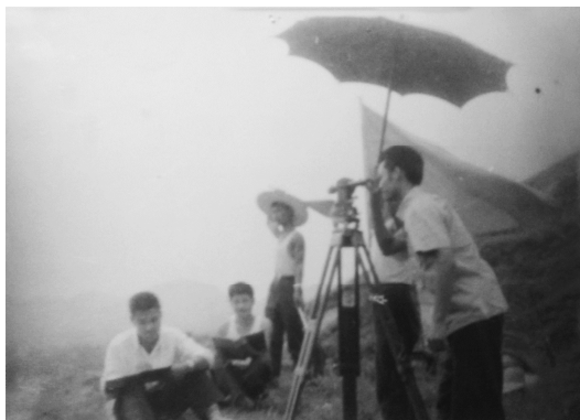
同学在峨眉新校址进行测量

要求将学校的建设项目纳入国家大中型项目的供应渠道，由省归口供应，恢复大中型重点项目待遇，以利于加速完成续建任务 ① 。经过努力不懈地反映和做工作，后来，终于争取到了恢复大中型重点项目的待遇。