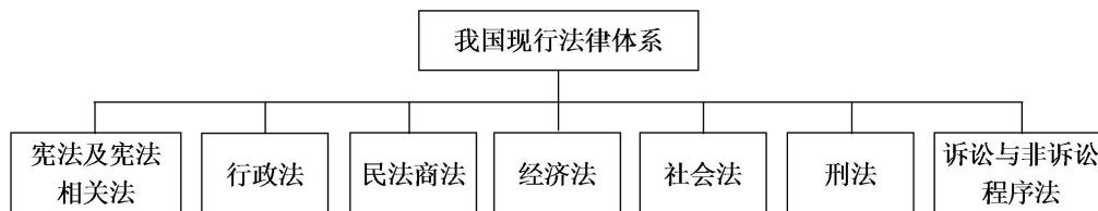
图 1.1 我国现行法律体系示意图

体包括《中华人民共和国宪法》《全国人民代表大会组织法》《国务院组织法》《选举法》《授权法》《立法法》《国籍法》等。