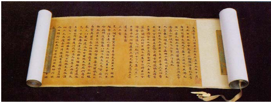
图 1-7 卷轴装