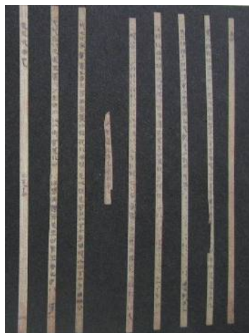
图 1-6 版牍