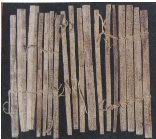
图 1-5 竹简