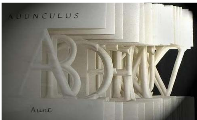
图 1-3 书籍装帧艺术形式美