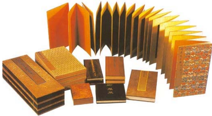
图 1-8 经折装

经折装又称折子装，出现在 9 世纪中叶以后的唐代晚期。经折装是在卷轴装的形式的基础上改造而来的。随着社会发展和人们对阅读书籍的需求增多，卷轴装的许多弊端逐步暴露出来。例如，要查阅中间某一段，必须从头打开，看完后还要再卷起，十分麻烦。经折装的出现大大方便了阅读，也便于取放。具体做法是：将一幅长卷沿着文字版面的间隔中间，一反一正地折叠起来，形成长方形的一叠，在首尾两页上分别粘贴硬纸板或木板，有时再裱上织物或色纸，作为封面。它的装帧形式与卷轴装已经有很大的区别，形状和今天的书籍非常相似。在书画、碑帖等装裱方面一直沿用到今天（图 1-8）。