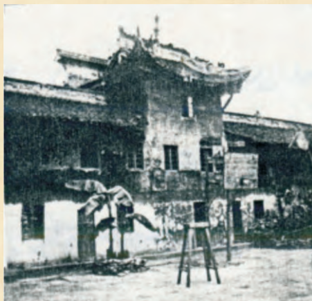
内江公学政治班的教室。每到节假日，政治班的学员们都要上街或到乡镇宣传反帝、反封建、反军阀的国民革命思想。教唱打土豪、分田地的国民革命歌曲。