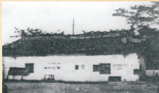
武庙，原内江一初中。1927年，内江县城人力车工会成立地点。