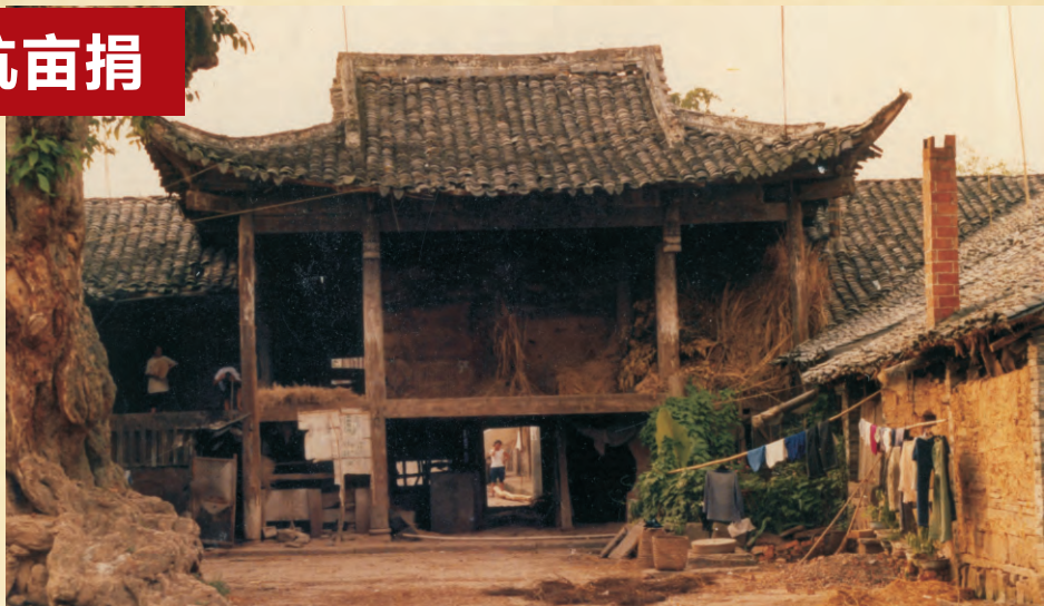
东乡农协会会员集聚杨家场的关帝庙，参加清账的主会场

1929年7月，中共内江县委书记曾莱在东乡石子镇吴王庙召开有东南区委书记和各支部负责人参加的扩大会，主要讨论如何开展秋收斗争问题。会上杨家乡党支部书记周执中提议：杨家乡副团总与“方保”（地方保长）士绅为争夺团总实权有矛盾，我们可以抓住这个契机开展斗争。会议最后决定：斗争首先在杨家场开展，方式以抗缴地亩捐为主，目的是减轻农民的经济负担，斩断团阀经济来源，解散县团阀豢养的五个中队兵力，把枪支收回农民掌握，然后转入减租减息斗争。