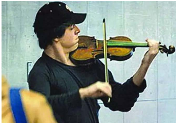
图 1.4 音乐家约夏·贝尔于地铁站内演奏

2007 年一个寒冷的上午, 在华盛顿特区的一个地铁站里, 一位男子用一把小提琴演奏了 6 首巴赫的作品, 共演奏了 45 分钟左右。他前面的地上, 放着一顶口子朝上的帽子。显然, 这是一位街头卖艺人。