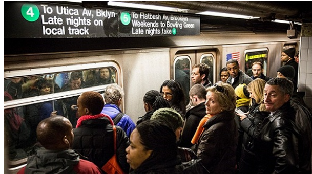
图 1.2 美国纽约市地铁车站的乘客

毕竟，我们在其他的公共场合能够做到这一点。例如，当行人走在人行道上，他们懂得利用缝隙快速超过走得慢的人或者人群，但公共交通限制了我们的行动，因此，我们优先考虑获得控制权，即使牺牲舒适性也在所不惜。这最终变成了一种避免和其他人接触的欲望，而它也很好地解释了为什么我们总是盯着车顶却能够在第一时间抢到空位，并能够阻止别人往窗边移动。《纽约时报》2013 年的一则报道称，站着的乘客避免与坐着的