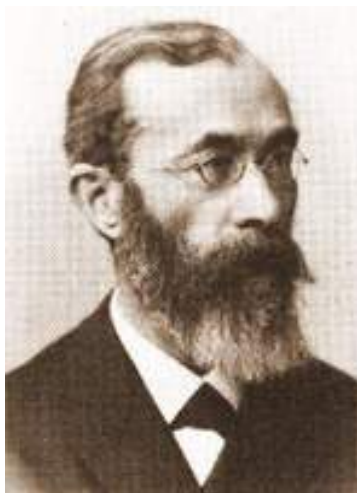
图 1.5 德国心理学家冯特·威廉 (Wilhelm Wundt)

作为一门科学，心理学的历史却十分短暂，19 世纪中叶以后，由于自然科学的迅猛发展，为心理学成为独立的科学创造了条件。尤其是德国感官神经生理学的发展，为心理学成为独立的科学起了较为直接的促进作用，到 1879 年，从德国心理学家威廉·冯特 (Wilhelm Wundt) 在莱比锡大学建立了世界上第一座心理学实验室开始，才形成了注重实验和实证的科学心理学的传统，标志着科学心理学的诞生，从此，心理学从哲学中分化出来，成为一门独立的科学，开始了蓬勃发展的历程。