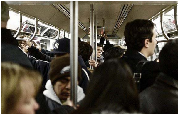
图 1.3 美国纽约市地铁列车内的乘客