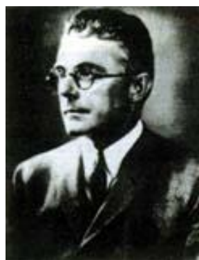
图 1.8 行为主义流派创始人 华生 (J.B.Waston)

行为主义产生的标志是 1913 年美国著名的心理学家华生 (J.B.Watson) 发表了《一个行为主义者眼中所看到的心理学》，宣告了行为主义学派的诞生。行为主义有两个重要的特点：一是反对心理学研究看不见、摸不着的意识，主张研究可以观察的事件，即行为；二是反对内省，主张用客观研究的方法，即实验的方法。在华生看来，意识是看不见、摸不着的，因而无法对它进行客观的研究。心理学的对象不应该是意识，而应该是可以观察的事件，即行为。同时，行为主义把刺激-反应 (S-R) 作为解释行为的基本原则。新行为主义者托尔曼曾试图在刺激与反应之间引进认知、期望、目的等作为中间变量，但斯金纳反对任何形式的内因论，拒绝中间变量，认为强化和改变行为的主要动力是有机体“操作”环境的效果。赫尔则力图从方法着手，抛弃“观察—归纳”法，采用“假设—演绎”法，以便把心理学建成近似于几何学的演绎科学。行为主义产生后，在各国心理学