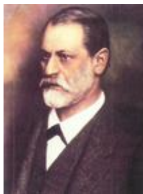
图 1.7 精神分析流派创始人 弗洛伊德 (S.Freud)

精神分析产生于 19 世纪末 20 世纪初，由奥地利医生弗洛伊德 (S.Freud) 创立。与传统心理学派别不同，精神分析学派不关心对意识经验和正常行为的研究，它强调心理学应研究无意识现象和异常行为。该学派的理论根据是来自对精神病患者诊断治疗的临床经验。弗洛伊德认为，人格是由本我、自我和超我构成的系统。一个人的精神状态是人格的这三种力量相互矛盾冲突的结果。并且认为，意识是人的整个精神活动中很小的一部分，处于心理表层。无意识才是人的精神活动的主体，处于心理的深层，它是被压抑的或未变成意识的本能冲动。性欲则是人的所有本能冲动中持续时间最长、冲动力最强，对人的精神活动影响最大的本能。精神分析学派对心理学的重要贡献在于，他把心理区分为意识和无意识，并关注需要、动机等心理的动力因素。但他把人的一切行为都看成是被压抑的性欲的表现，认为无意识决定意识甚至决定社会发展是错误的。