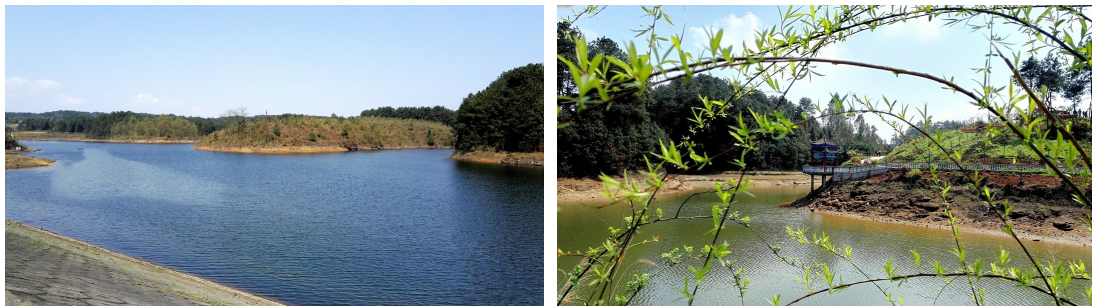
图 2 朝皇寺水库