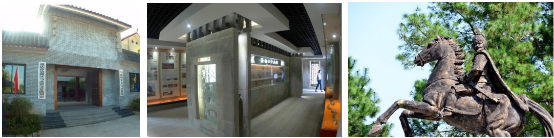
图 7 马武将军文化博览馆