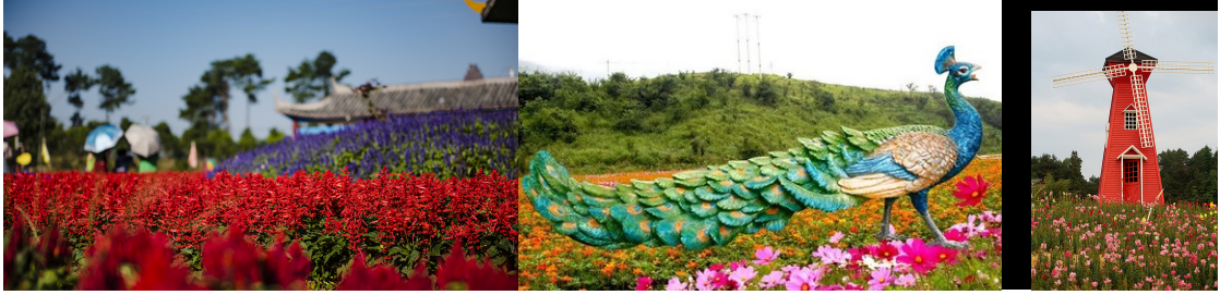
图 5 园林花海