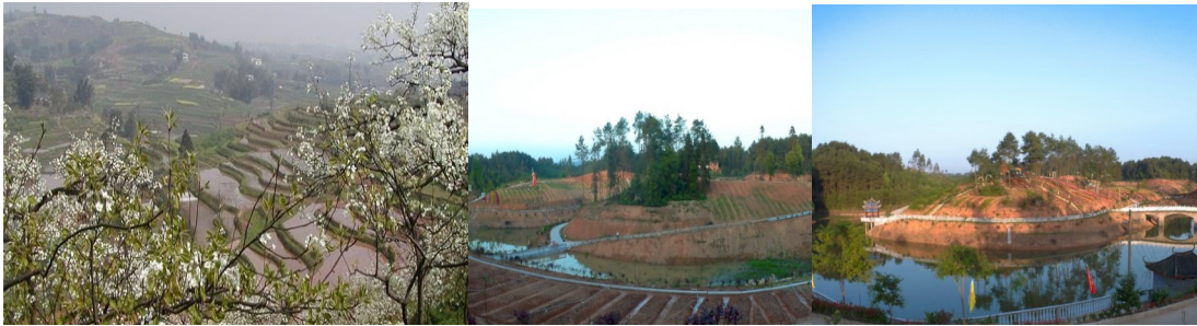
图 1 低矮浅丘