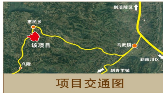
项目距离马武镇 10 千米，距离涪陵区 25 千米