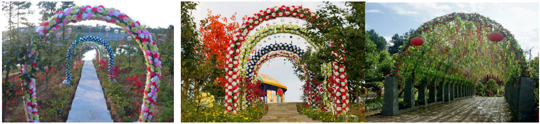
图 6 观光花廊