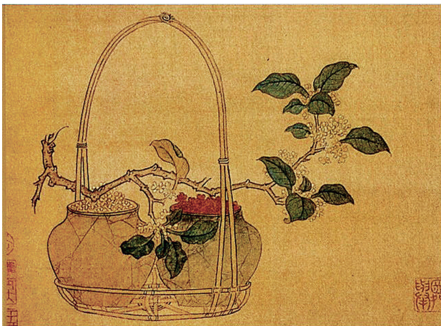
(元) 钱选《吊篮式自由花》