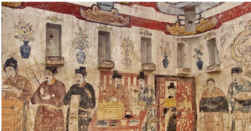
宣化辽墓壁画里茶事活动中的插花

宋代插花艺术发展到极盛，并逐渐融入茶事活动中，出现了许多有较高水平的书籍，如《葵辛杂识·续集》《分门琐碎录》《山家清事·插花法》等。受理学思想的影响，插花艺术特别注重构思的理念和内涵，花材多选用寓意丰富的松、竹、梅、兰、桂、山茶、水仙等上品花木，构图追求线条美，思想上更强调作者的理想或人生的抱负、品德，等等。在宋代，插花和点茶都受到文人推崇，较好地融入茶事活动中。点茶、插花、焚香、挂画为宋人生活四艺。茶室插花深得文人推崇。宋人洪咨夔在《夏初临》中云：“铁瓮栽荷，铜彝种菊，胆瓶萱草榴花……雪丝香里，冰粉光中，兴来进酒，睡起分茶……”宋徽宗的《文会图》展示了他和大臣们斗茶、分茶的情景，其中茶席上摆放了六副插花作品。