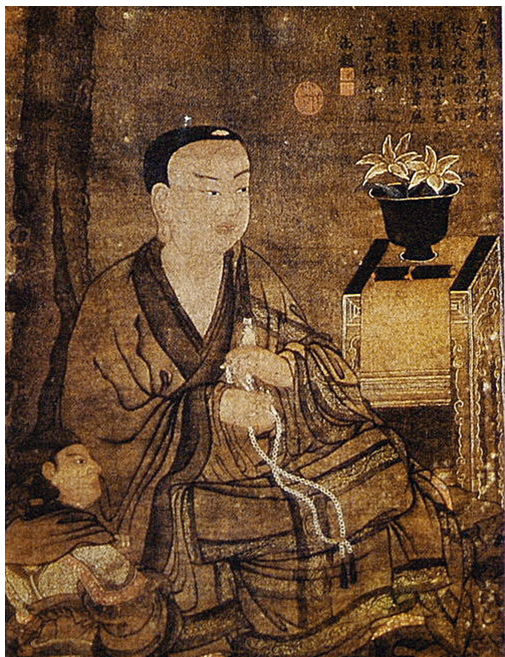
（唐）罗汉图中的插花

载：“有献莲花供佛者，众僧以铜罍盛水渍其茎，欲华（花）不萎”，人们“以花献佛，祈求医病”。当时佛前供花以荷花与柳枝为主要花材，表现善男信女对佛的崇拜与恭敬。公元6世纪北周的观音像（现存英国维多利亚博物馆）手持瓶花，枝叶比例协调，这也是早期东方式插花的见证。隋唐时代，是中国插花艺术发展史上的兴盛时期。每年农历二月十五日为