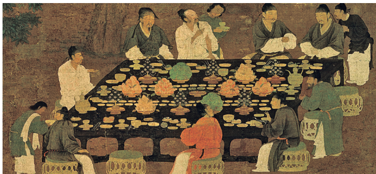
(宋) 赵佶《文会图》局部 点茶席上的六副插花作品