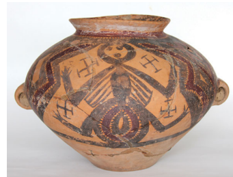
图1 马家窑文化陶罐

[7] 巫术在人们的社会生活中起着决定性作用，小到结婚种田、行路求雨，大到行军打仗、政治决策，都离不开巫术。像图1马家窑文化陶罐上的四个“巫”字，是写在奇怪人物的四肢上方位置，而这个阴部夸张突出的奇怪人物明显带有生殖巫术的意味，也就是说这应该是一个巫师的形象，而其所表达的意旨应该就是生殖巫术。