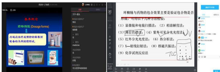
图2 讲解环糊精包合技术

培养学生对专业的热爱，杜绝“口号式”的教育。将教师对专业的热爱自然而然地渗透到学生心中，以实例感染学生，“随风潜入夜，润物细无声”。例如此次疫情中，在讲述环糊精包合技术时，引导学生针对抗新型冠状病毒有效但溶解性较差的药物，可考虑采用环糊精包合技术，既可以解决水溶液中溶解性差的问题，也可提高药物稳定性。